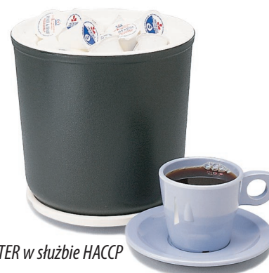
COLDMASTER w służbie HACCP